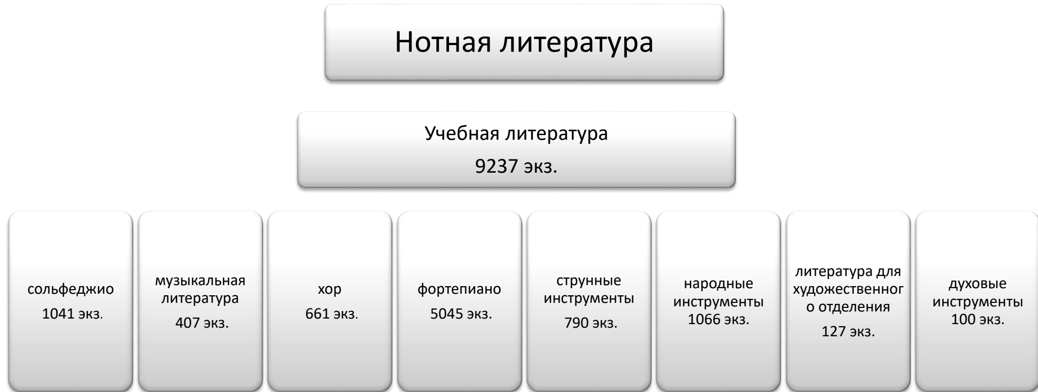
Рис. 4. Структура библиотечно-информационного обеспечения